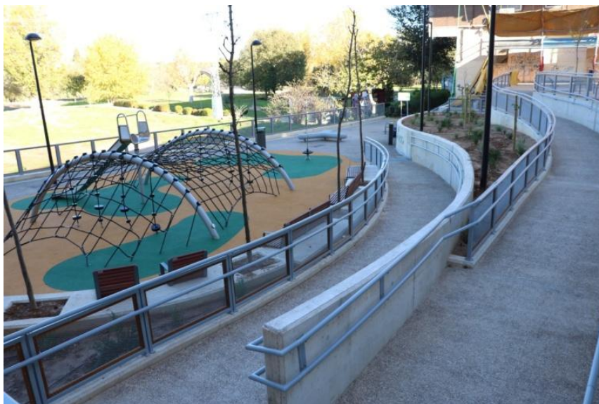
IMAGEN DE LA ACTUACIÓN COMPLETADA. AL FONDO, EL PARQUE FLUVIAL DEL RÍO TURIA

La actuación financiada ha permitido convertir un solar sin uso y degradado en un Parque para uso y disfrute de la ciudadanía de todas las edades, consiguiendo que haya recuperado su valor estratégico. Allí se han instalado juegos infantiles, bancos para el descanso, vegetación y arbolado para proporcionar sombra. Asimismo, se ha abierto una nueva entrada al espacio natural del río Turia, con una amplia rampa para que peatones y ciclistas puedan acceder al recorrido del cauce. Por último, se han instalado farolas con luminarias tipo led para favorecer el ahorro energético.