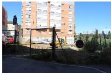
La parcela en la que se ubicará el nuevo parque. (1)

La actuación, que cuenta con un presupuesto de 180.000 euros, prevé eliminar las escaleras existentes y limpiar la acera.