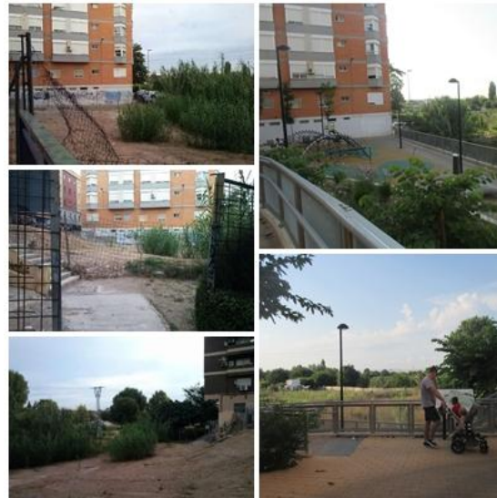
EL ÁREA DEGRADADA SE HA CONVERTIDO EN UN ESPACIO AGRADABLE Y SOSTENIBLE

Con la actuación se ha conseguido el objetivo de difundir y poner en valor el patrimonio natural y cultural de la zona y potenciar sus posibilidades para el aprovechamiento turístico. También se ha logrado transformar un espacio degradado y sin uso para dar paso a un área agradable y accesible a los vecinos y vecinas.