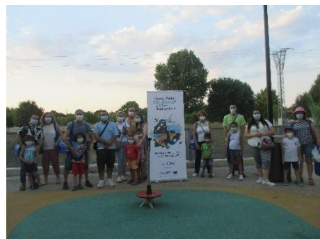
ENCUENTRO CON LA CIUDADANÍA PARA DAR A CONOCER LA IMPORTANCIA DE LA COFINANCIACIÓN EUROPEA PARA PONER EN MARCHA ESTE PROYECTO