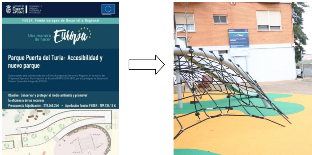
CARTEL INFORMATIVO DE LA OBRA

En lo relativo a la Comunicación Reglamentaria, se ha colocado, durante la realización de los trabajos, un cartel informativo de obra y, tras la finalización de la misma, una placa permanente. Asimismo, la operación se ha incluido en el apartado específico del portal web municipal único del Estado Miembro: https://feder-edusi.quartdepoblet.es .